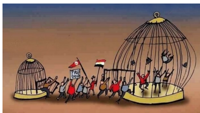
L'ascension New Age

Il ne s'agit pas d'une théorie spirituelle New Age 3 , mais d'une vérité qui pourrait être démontrée, tout comme l'ascension collective qui est sur le point de se réaliser. J'y reviendrai aussi ultérieurement.