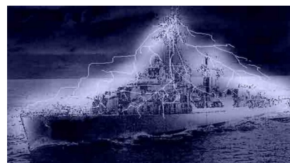
Expérience de Philadelphie

Des découvertes scientifiques datant de 1933 sont actuellement utilisées par la "Kabbale sombre" pour freiner au maximum l'éveil de l'humanité. Cette manipulation est en lien avec l'expérience de Philadelphie 1 (projet Montauk, dont je vous reparlerai ultérieurement afin que vous puissiez faire des rapprochements).