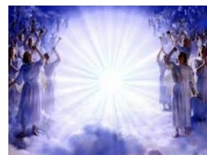
Illusion de la mort - NDE

Poursuivons. Sachant que la densité dans laquelle vous évoluez est liée à la gravitation, et que la gravitation contient toutes les potentialités dont celle du temps, il est aisé de comprendre que l’interprétation que vous faites de votre densité est une “illusion”, qui prend forme et devient réelle dès lors que votre ego alimente sa réalité à travers ses croyances. Vous restez ainsi enfermés dans un schéma qui vous poursuit durant toutes les incarnations, et contrairement à ce que l’on souhaiterait vous faire croire, même jusque dans l’au-delà : le plan astral ou l’après-vie.